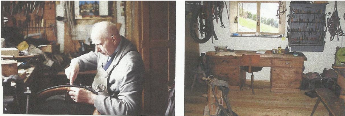
Abbildung 3 – Arbeitsstätte, Werkzeuge und Erzeugnisse des Sattlers

Durch die weit verbreitete Nutzung von Kutschen im 15. Jahrhundert ergab sich für den/die Sattler/in ein weiteres Betätigungsfeld. Sitzpolsterung, Innentapezierung, lederne Verdecke und wasserdichte Überzüge gehörten ebenso dazu wie Riemenzeug, Lederkoffer und Reisetaschen. Seit dem 17. Jahrhundert war er/sie auch als Polsterer/in und später, vor allem auf dem Land, als Tapezierer/in tätig.