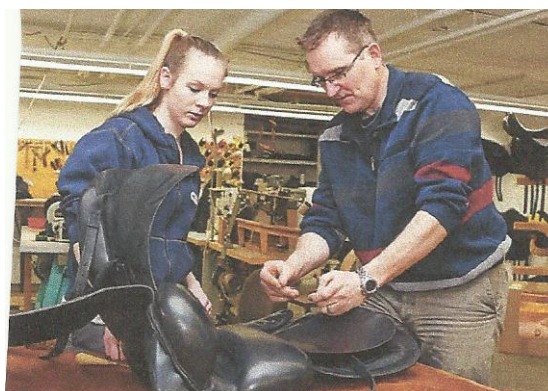
Abbildung 6 – Der Sattlerberuf heute

Anfang der 1950er Jahre gab es in Deutschland noch über 75.000 Sattlereibetriebe. Aufgrund der Motorisierung in der Landwirtschaft verschwanden sie innerhalb weniger Jahre fast zur Gänze, da dadurch Pferde praktisch überflüssig wurden. Heute gibt es in Oberösterreich nur mehr wenige Betriebe, deren Inhaber/innen zur Gänze von ihrem Handwerk leben. In den letzten 35 Jahren erfuhr mit der Wiederbelebung der Pferdenutzung im Hobby- und Sportbereich auch der Sattlerberuf eine Renaissance. Der/die Reitsportsattler/in stellt überwiegend Sättel, Riemenzeug, Fahrgeschirre und Zaumzeug her. Die weiteren Arbeitsbereiche der Sattler/innen sind heute Fahrzeugsattler/in und Feintäschner/in. Fahrzeugsattler/innen stellen neben Lederbezügen für Fahrzeugsitze auch komplette Autoinnenausstattungen, Planen und Cabrio-Verdecke her. Feintäschner/innen fertigen Aktentaschen, Geldbeutel sowie Taschen, Beutel und Koffer aus Leder oder Kunstleder.