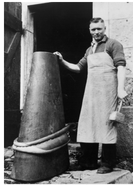
Abbildung 5 – Kummetstock