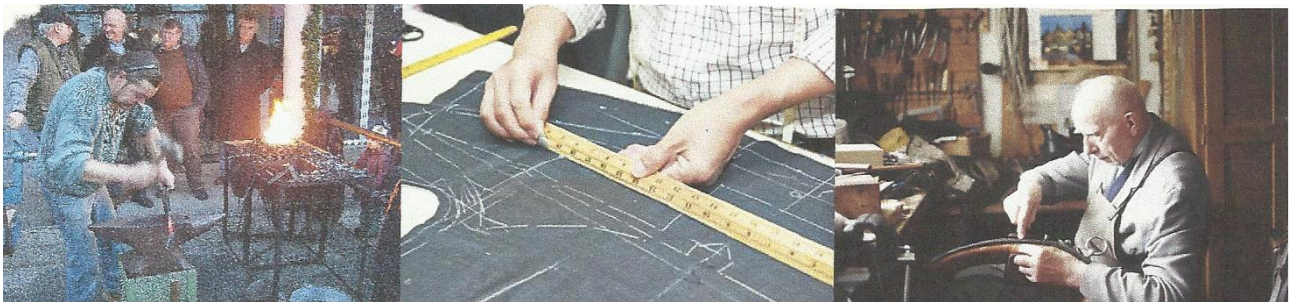
Abbildung 1 – Beispiele für Handwerker: Schmied, Schneider und Sattler

Das wesentliche Kennzeichen des alten Handwerks ist die kleinbetriebliche Produktion. Die Arbeit findet im Alleinbetrieb oder im Kleinbetrieb statt. Wo der/die Meister/in nicht allein arbeitete, beschäftigte er/sie bis ins 18. und 19. Jahrhundert meist kaum mehr als einen oder zwei Gesell/innen oder Hilfskräfte. Die Größe und Produktivität der Betriebe war durch die Zunft und durch die Handwerkerbünde geregelt. Charakteristisch für den Handwerksbetrieb ist die Mitarbeit des/der Meister/in. Wesentlich für das Handwerk ist auch der geregelte Ausbildungsgang. Dieser umfasst eine Lehre und Gesellenzeit.