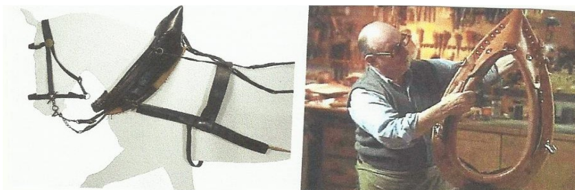
Abbildung 2 – Kummet: Ein Kummet ist ein gepolsterter Ring aus Leder, der dafür sorgt, dass die Pferde den Pflug mit ganzer Kraft ziehen können und dabei die Last auf Schulter und Brust aufgeteilt wird.

Schon in der Steinzeit arbeiteten die Menschen mit gegerbten Fellen und Häuten von Tieren, um zum Beispiel Mützen oder Schuhe herzustellen. Im Beruf Sattler/in wird Leder verarbeitet. Der/die Sattler/in stellt aus Leder Gegenstände her, die zur Verwendung im Umgang mit Tieren dienen. Beispiele hierfür sind Sättel, Zaumzeug oder das Kummet. Anfangs gerbten die Sattler/innen die Häute, die sie von Metzgern und Abdeckern kauften, selbst; später bezogen sie diese dann von den Gerber/innen. Die Produkte wurden meist auf Bestellung hergestellt. Vielfach zogen Sattler mit ihrem Handwerkszeug über Land (Stör), um dort vor Ort nach Bedarf ihre Produkte herzustellen.