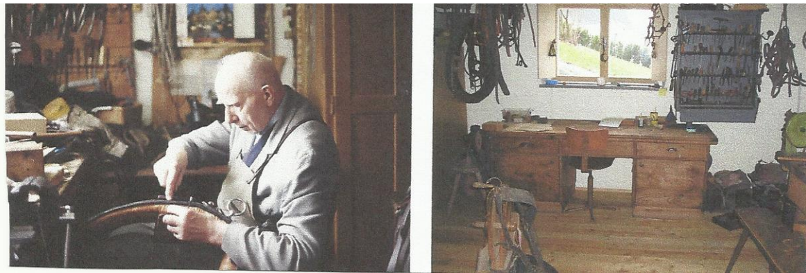
Abbildung 6 – links: Sattlermeister bei der Arbeit in seiner Werkstatt (Foto: Felix Maschek) rechts: Museumswerkstätte des Sattlermuseums in Hofkirchen im Traunkreis (Foto: Josef Wieser)