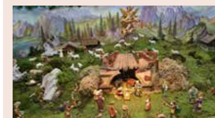
Im museum.ebensee aufgestellte Krippe

Führungen für Gruppen sind nach Voranmeldung auch außerhalb der Öffnungszeiten möglich: Dr. Franz Gillesberger +43 (0) 676 83 940 778, museum@ebensee.ooe.gv.at