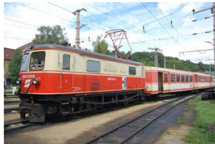
ÖBB 1099.001 in St. Pölten

Die Loks wurden nicht nur technisch, sondern auch ästhetisch genau geplant, damit begann die internationale Aufmerksamkeit für den Konstrukteur Ing. Karl Gölsdorf. Die 108 zählt zu den schönsten „Atlantics“ weltweit. Das Einsatzgebiet waren Schnellzüge auf den Strecken Wien – Prag, Wien – Krakau – Lemberg, Prag – Linz, Wien – Gloggnitz und Bozen – Ala. Die nach 1919 in Österreich