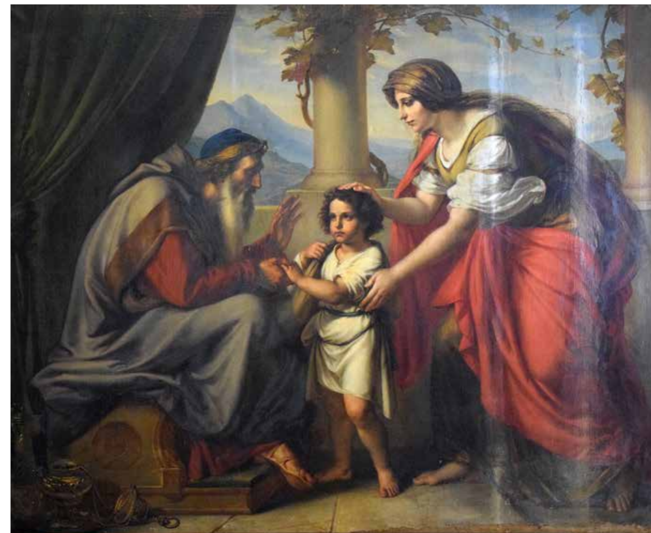
„Hanna bringt Samuel zu Eli“. Ölgemälde des Historienmalers Julius Hübner, 1850