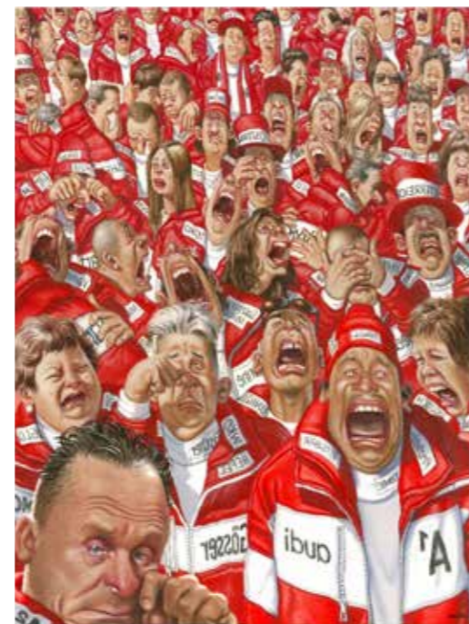
Enttäuschte Österreicher (Urheber: Gerhard Haderer)

Dienstag bis Sonntag, Feiertag 10:00 bis 18:00 Uhr Montag geschlossen (feiertags geöffnet) www.oelkg.at