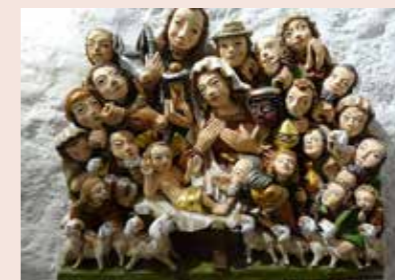
Keramikkrippe von Robert Himmelbauer