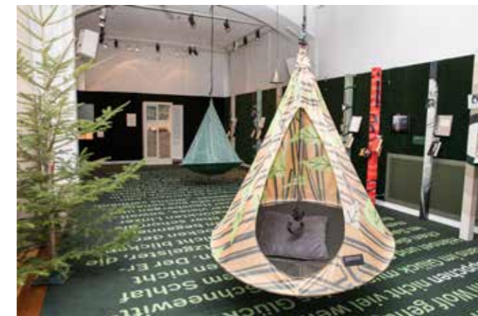
Blick in die Ausstellung

Dienstag bis Sonntag 10:00 bis 15:00 Uhr www.stifterhaus.at