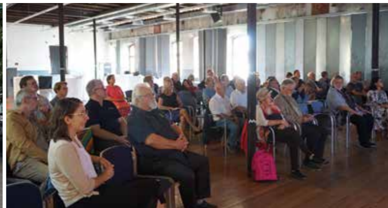
Die Tagungsteilnehmerinnen und -teilnehmer

Anlässlich der diesjährigen Oberösterreichischen Landesausstellung Arbeit – Wohlstand – Macht in Steyr wendeten wir uns im Rahmen des Tags der OÖ Regional- und Heimatforschung am 11. September 2021 der Eisenwurzen in Oberösterreich zu – eine vielfältige Region, in der man den jahrhundertealten Spuren der Metallverarbeitung auf Schritt und Tritt begegnet. An den drei Standorten der Landesausstellung – Museum Arbeitswelt, Innerberger Stadel und Schloss Lamberg – wurden unter anderem Menschen in den Fokus gerückt, die bis heute die Stadt Steyr und die Identität und Mentalität ihrer Bewohnerinnen und Bewohner prägen. Aber auch die gesamte Region der Eisenwurzen wartet mit einem reichen kulturellen Erbe auf, von dem es noch einiges zu entdecken gilt. Einige Aspekte dazu wurden im Rahmen der Tagung beleuchtet.