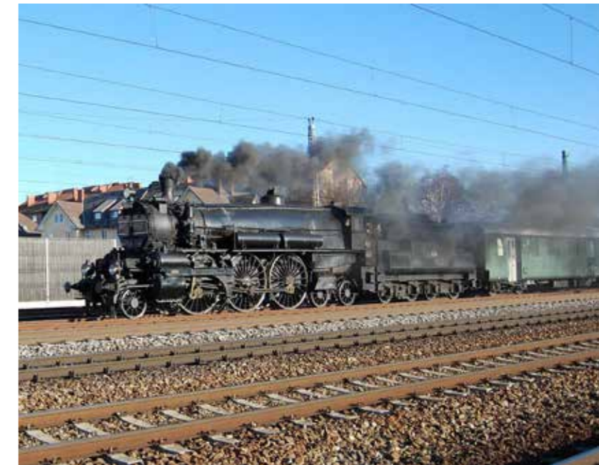
Museumslokomotive kkStB 310.23

Technische Daten: Bauart 1'F h4v, 1 Stück, Hersteller Floridsdorf, Vmax 60 km/h, Leistung 2100 PS, Gewicht Lok 95,77 Tonnen