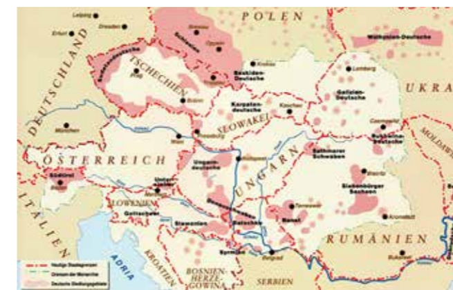
Karte „Deutsche Siedlungsgebiete in Mitteleuropa“

Das Beskidenland (Beskidenvorland) ist eine informelle Bezeichnung für das Gebiet im Einzugsbereich der heu- te in Polen liegenden Stadt Bielitz-Biala ( Bielsko-Biala ). Der zum Karpatenbogen gehörende Gebirgszug der West-Beskiden ist Namensgeber für diese Region. Die deutsche Sprachinsel entstand gegen Ende des 13. Jahr-