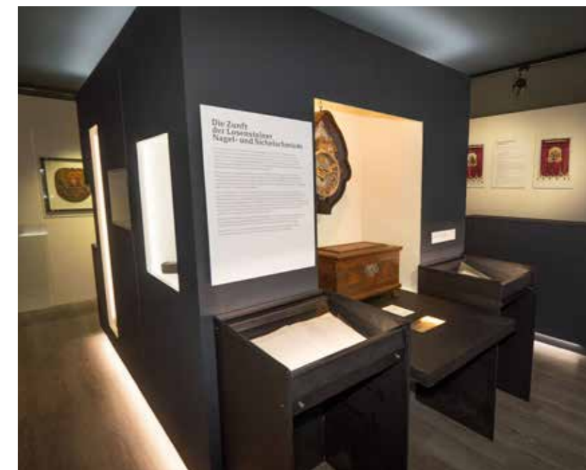
Ausstellungsansicht: Das neu gestaltete Nagelschmiedzimmer am neuen Standort in der Mittelschule Losenstein

Den „Erben der Nagelschmiede“, den jetzt in Losenstein tätigen Firmen, deren Existenz den Bewohnerinnen und Bewohnern des Ortes Arbeit und Wohlstand bringt, sind zwei informative Schaubilder gewidmet. Zwei Höhepunkte sind die Touchscreens im Mittelblock der Schau: Auf einem Monitor wird der thematische Wanderweg zur „Brandstätter Schmiede“ mit seinen acht Stationen