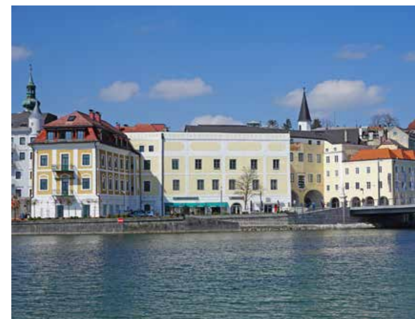
Blick auf das Ensemble des K-Hof Kammerhof Museums Gmunden mit der Bürgerspitalkirche im Hintergrund

Elisabeth Kreuzwieser: Ein dichtes Programm! Wir wünschen euch alles Gute für die kommende Museums-saison!