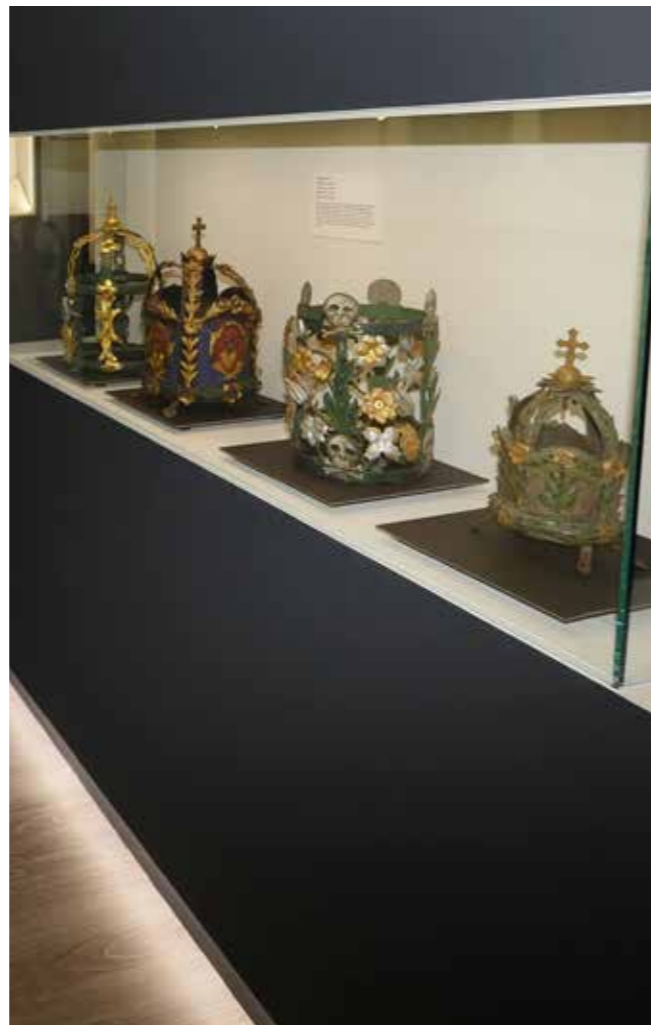
Ausstellungsansicht: Das neu gestaltete Nagelschmiedzimmer am neuen Standort in der Mittelschule Losenstein