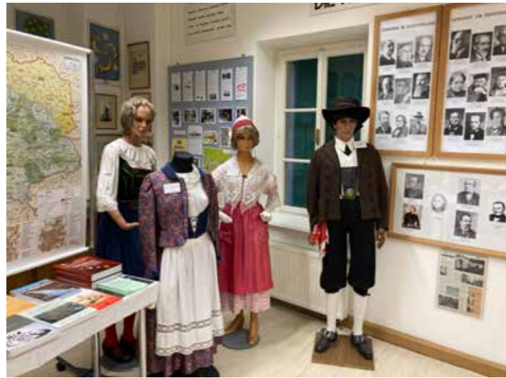
Blick in den Ausstellungsbereich „Trachten aus dem Sudetenland“

In Enns entstand durch vertriebene Menschen aus Gablonz an der Neisse ( Jablonec nad Nisou ) ein eigener Stadtteil mit Betrieben und Wohnhäusern sowie einer