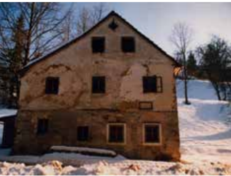
oben: Die „Brandstätter Schmiede“ vor der Renovierung