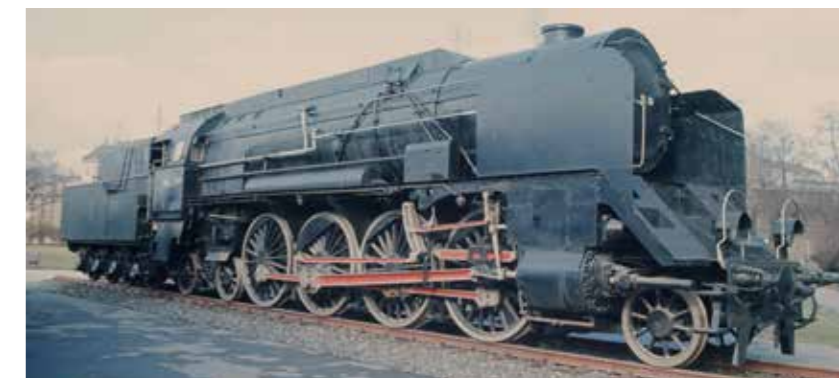
StLB VT 32 in der Erstaufführung, Tamsweg