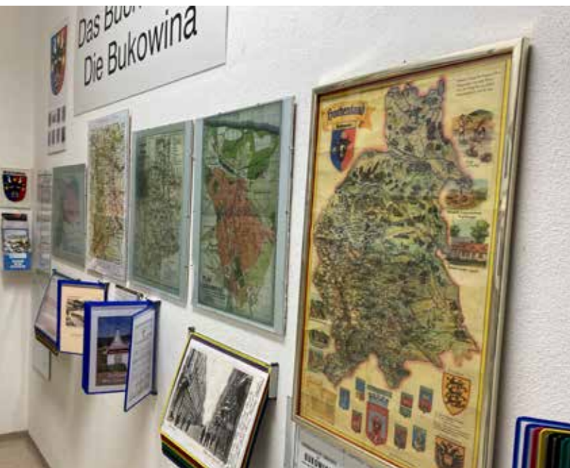
Blick in den Ausstellungsbereich „Das Buchenland - Die Bukowina“

worbenen Bücher, Bilder und Grafiken bildeten die Basis für die nach ihm benannte Sammlung Albertina in Wien.