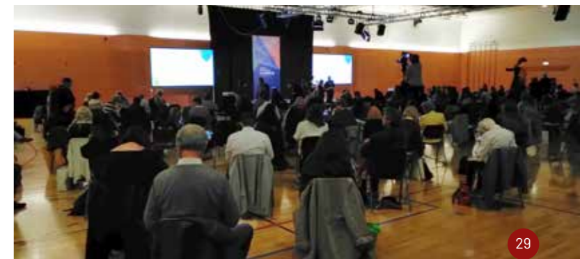
Die Hauptveranstaltung des Museumstages wurde bei großzügiger Bestuhlung in der Max-Kreitmayr-Halle in Friedberg abgehalten.

Freilichtmuseen wie das Fränkische Freilandmuseum Bad Windsheim können aber auch schon durch ihre Sammlungen Nachhaltigkeit vermitteln. Ländliche Lebensweise und Alltag haben, abseits von nostalgischen Verklärungen, einiges zu erzählen. Den Abschluss des Vortragsreigens bildeten die Erläuterungen zum Münchner Stadtmuseum. Seit langem ist hier schon von einer Neukonzeption die Rede. Umgesetzt werden konnten sie bis dato aber nie. Der aktuell präsentierte Anlauf soll 2025 beginnen. Man kann hier nur viel Glück wünschen.