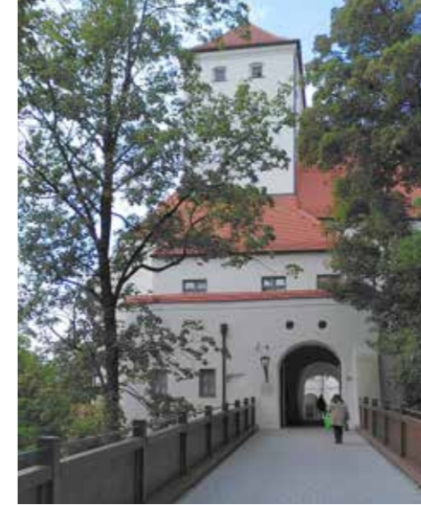
Eingang zum sanierten Wittelsbacher Schloss in Friedberg

Des Weiteren wurden die Vorbereitungen für die Neugestaltung des Stadtmuseums in Lindau vorgestellt, die im Zusammenhang mit den Sanierungsarbeiten am Cavazzen stehen, jenem Bürgerpalais, in dem das Museum untergebracht ist. Diese Vorbereitungen führten unter anderem zu einem 2015 festgeschriebenen Sammlungskonzept, das auch konsequent verfolgt wird. Bei den Planungen für ein Großobjektedepot im Freilandmuseum Oberpfalz ist auch Nachhaltigkeit ein Grundprinzip. Ein modernes Depot ist im Sinne der Präventiven Konservierung und in Hinblick auf die Erhaltungskosten der Museumsgüter natürlich schon von Grund auf nachhaltig, hier geht es aber auch um einen nachhaltigen Planungs- und Bauprozess.