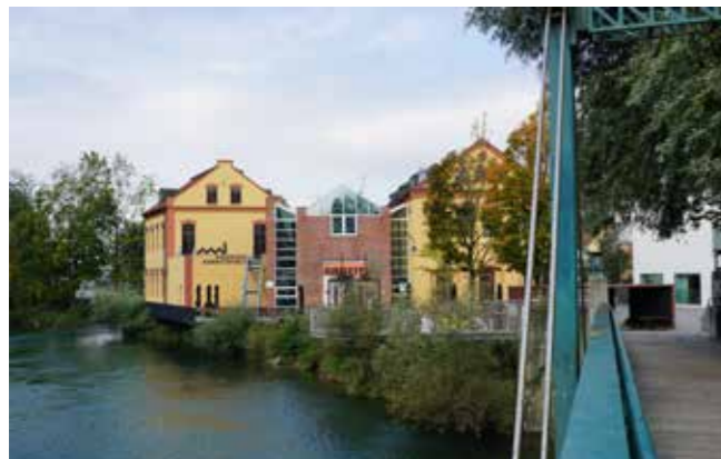
Zum Tag der OÖ Regional- und Heimatforschung 2021 wurde ins Museum Arbeitswelt in Steyr geladen.