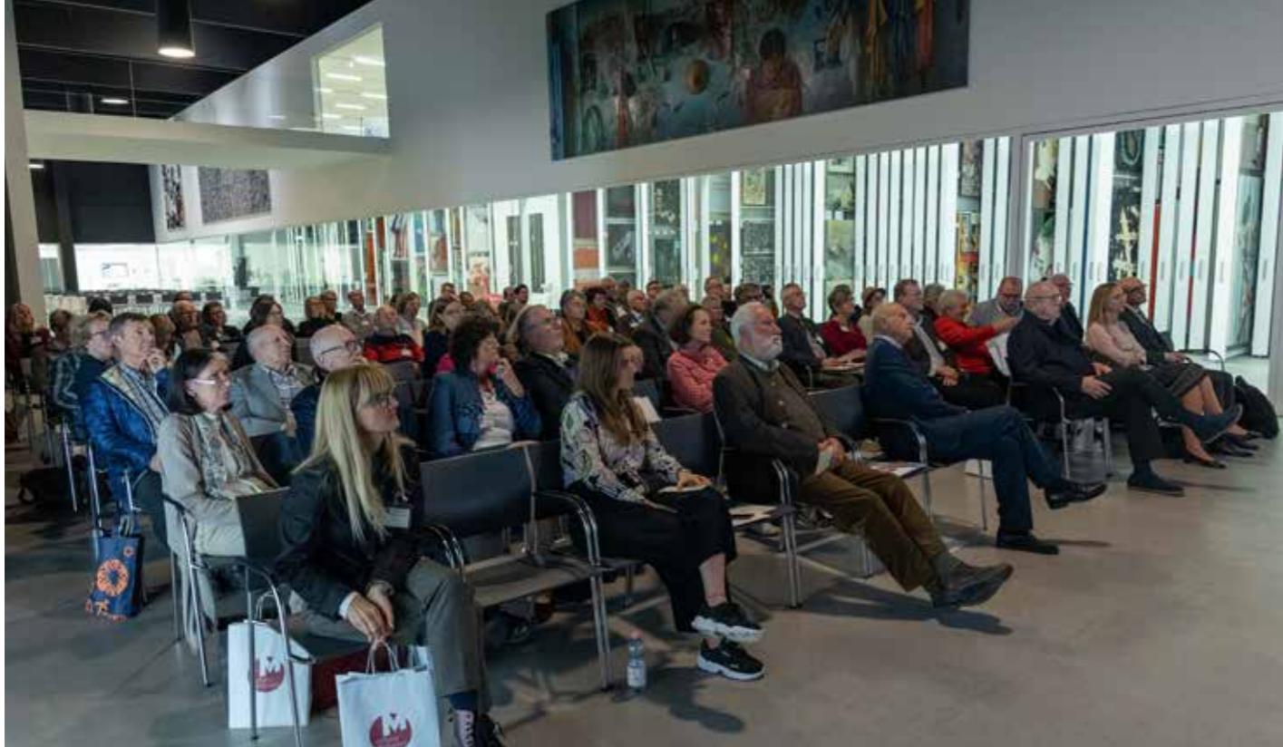
Rund 75 Mitarbeiterinnen und Mitarbeiter aus Oberösterreichs Museen folgten der Einladung zum Oberösterreichischen Museumstag.