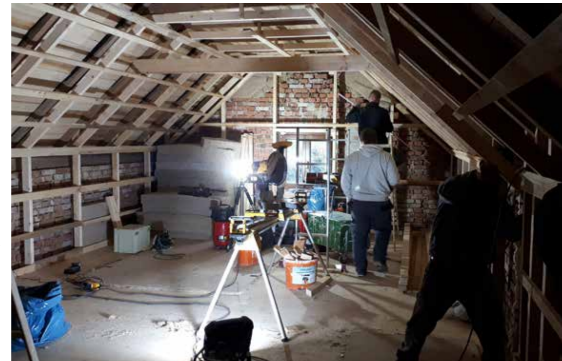
Trockenausbau des Schaudepots im Dachboden

So beschloss der Vorstand im Herbst 2019 den Bau eines Depots bis Ende des Jahres 2022. Dazu mussten das Dachgeschoß (über dem Vereins- und Workshopraum) über eine Stiege im Innenbereich zugänglich gemacht und der Dachboden in Trockenbauweise saniert werden. Für die sachgemäße Lagerung wurden circa 180 Laufmeter Regale und 500 Archivboxen geplant. Schließlich sollte das Arbeiten am Computer in allen Bereichen des Depots möglich sein, deshalb wurde die Anschaffung eines Laptops ebenfalls priorisiert.