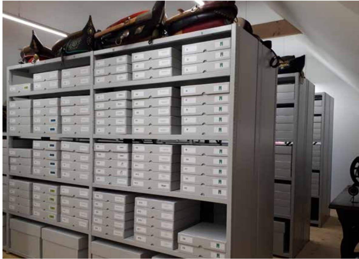
Die fertig eingeräumte „Bibliothek der Dinge“

Etwas stolz sind wir auf die rasche Umsetzung des Projektes Bibliothek der Dinge , das um ein Jahr früher als geplant abgeschlossen werden konnte. Was hat dazu beigetragen?