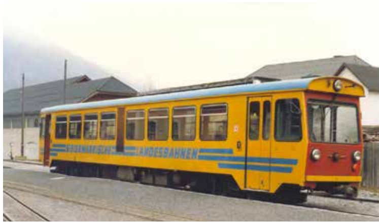
ÖBB 12.10 TMW, Wien 1976

bezeichnet) die ältesten noch im Betrieb stehenden Elektroloks der Welt. Die Loks waren auch über eine lange Zeit die stärksten elektrischen Schmalspurloks weltweit und sind immer noch die stärksten für 760 mm Spurweite in Europa.