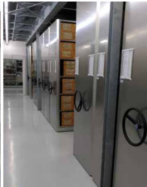
Links oben: Blick in das Schaudepot des Archäologischen Zentraldepots Augsburg