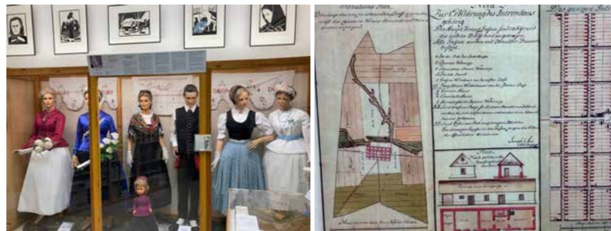
Blick in den Ausstellungsbereich „Donauschwäbische Trachten“

Der Ausstellungsbereich beginnt mit der Darstellung einer Besiedelungs- und einer Fluchtroute. Nach dem Sieg von Prinz Eugen über die Türken begann der Ruf nach Wiederbesiedelung der an der mittleren Donau gelegenen fast menschenleeren und verödeten Gebiete. Neben einigen kleineren Besiedlungswellen kamen mit den so genannten drei „Großen Schwabenzügen“ (1723 bis 1787) circa 150.000 Deutsche hauptsächlich nach Syrmien, in die Batschka, in das Banat, nach Slawonien und in das Sathmarer-Gebiet (Nordostungarn). Die Madjaren und Südslawen haben diese Siedler, die nicht nur aus den westlichen und südwestlichen deutschen Ländern (Pfalz, Baden, Württemberg, Elsass und