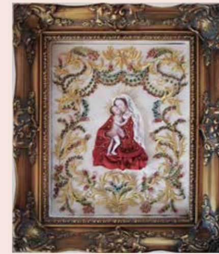
Perlenstickbild, Werkstück von Birgit Aigner

ckelarbeiten gezeigt. Nachweislich gibt es Klosterarbeiten seit dem 15. Jahrhundert, einen Höhepunkt erlebten sie in der Barockzeit im 17. Jahrhundert. Früher hat man mit dieser aufwendigen Technik Reliquien und Gegenstände der Andacht in Klöstern verziert. Es ist Kunsthandwerk auf höchstem Niveau, welches bei der Werkgruppe Klosterarbeiten im OÖ Volkswbildungswerk auch erlernt werden kann. Nähere Informationen dazu finden Sie auf www.werkgruppe-klosterarbeiten.at .