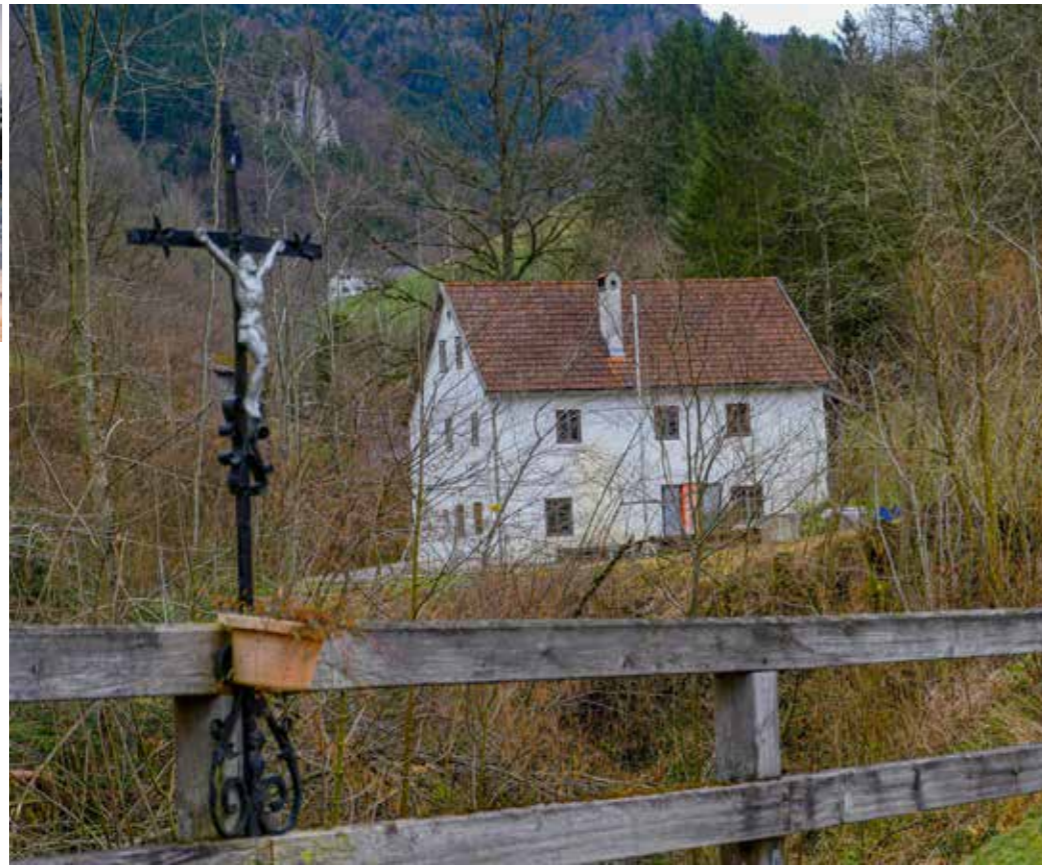
rechts: Die „Brandstätter Schmiede“ nach der Renovierung

ausführlich vorgestellt. Der andere Monitor zeigt die Losensteiner Ortsgeschichte auf der Basis einer Zeit- tafel, die OSR Franz Wurzer 1938 erstellt hat, und die vom Kulturverein Losenstein bis in die Gegenwart her- auf ergänzt worden ist.